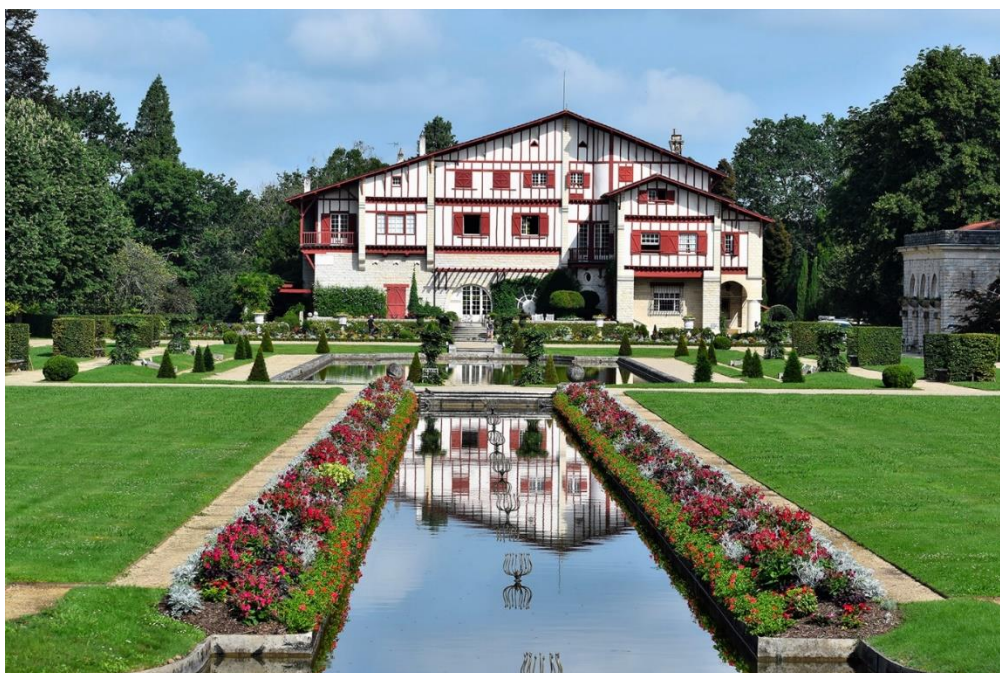
Villa Arnaga van Edmond Rostand

We starten met een bezoek aan CAMBO LES BAINS , waar we het huis van schrijver Edmond Rostand bezoeken; hier schreef hij "Cyrano de Bergerac".